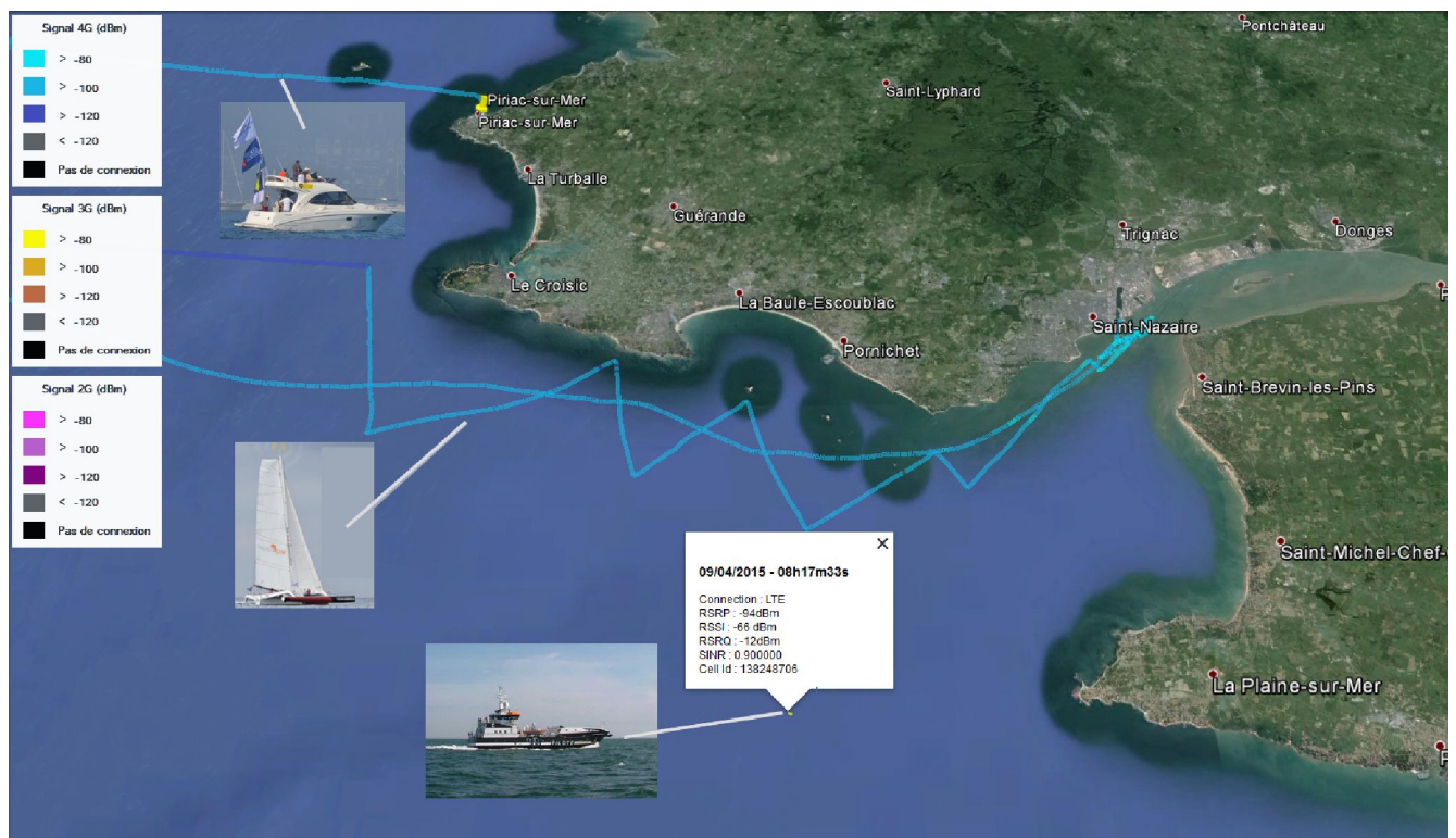
Résultats des mesures (en baie de Saint-Nazaire)

Quel est l'intérêt de l'Internet à bord de La Couronnée, leur bateau pilote ? Consulter un logiciel sur lequel défile la liste des bateaux programmés en sortie de port ; il est mis à jour en permanence par un pilote trafic à quai, et pouvoir y accéder en temps réel apporte un confort de travail supplémentaire. « Auparavant, l'Internet n'était pas fiable, il marchait à 60%, tombait en panne. On en devenait presque superstitieux », sourit-il. « Un autre logiciel bénéficie de cet Internet 100% fiable, le logiciel de maintenance. Enfin, le confort à bord est considérablement amélioré : les équipages de la Couronnée, 6 personnes, s'embarquent pour une semaine entière avant de revenir à quai pour être relayés par la prochaine équipe. Pouvoir consulter ses mails, téléphoner en wifi pendant cette semaine sur le bateau, permet de garder le contact avec la vie à terre. »