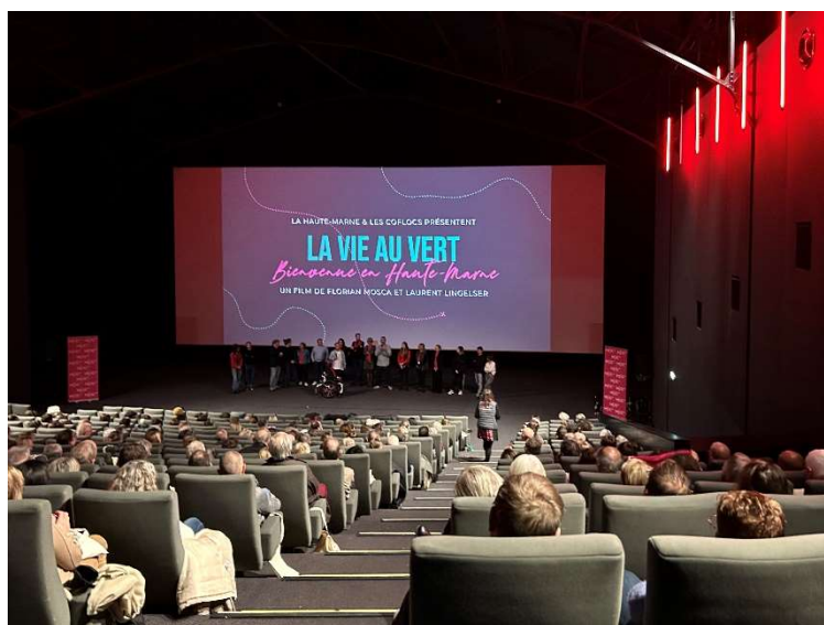
L'avant-première à Chaumont avec près de 400 personnes.

Avant sa sortie à Paris, le film documentaire est sorti en avant-première en Haute-Marne, lors de quatre soirées à destination des habitants du département : à Langres, Chaumont, Bourbonne-les-Bains et Saint-Dizier. Elles ont rassemblé près de 1000 personnes.