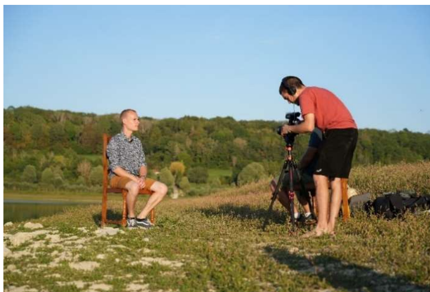
Le tournage a duré plusieurs mois.

Chaque image, chaque vidéo témoigne de leur capacité unique à saisir l'âme des lieux et des gens qu'ils rencontrent.