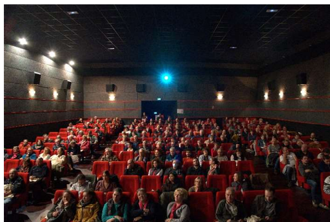
Les avant-premières ont rassemblé près de 1000 personnes.