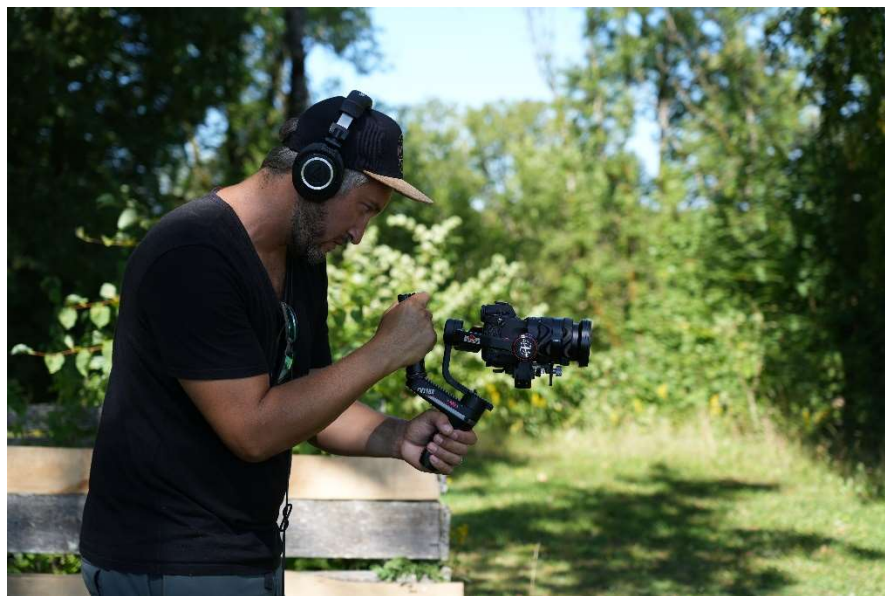
Lors du tournage.

Le film documentaire « La Vie au vert, Bienvenue en Haute-Marne » est un moyen-métrage d'une durée de 40 minutes . Il part à la rencontre de 9 personnes ou familles haut-marnaises. Chacune d'entre elles témoigne de sa vie , parle de son emploi, de sa vie de famille, de ses loisirs, de sa vie sociale, le tout dans des endroits qu'elles affectionnent ou qu'elles côtoient régulièrement.