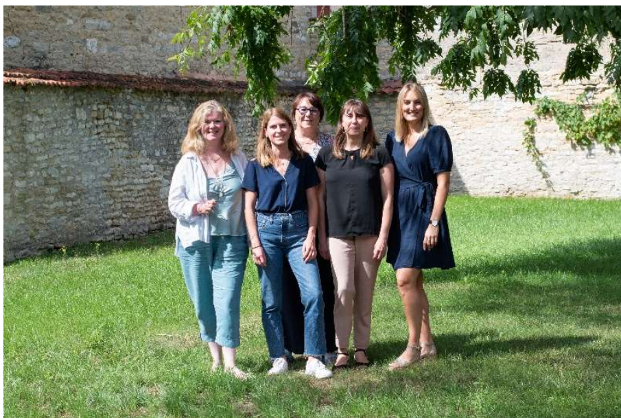
L'équipe de la conciergerie de la Haute-Marne.

Un contact et l'accompagnement démarre : conciergerie@attractivite52.fr ou au 03 25 03 80 80.