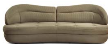
Canapé DUNE 2 places Best-seller de l'automne, 2 696 euros