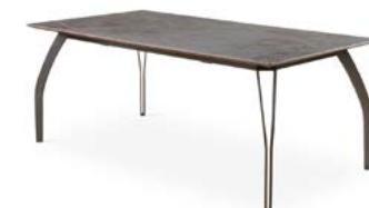
CASAA 2 933 euros

Plus de 25 autres meubles des collections bénéficient de cette révision tarifaire au sein des collections best-seller de la marque.