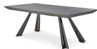
Table à manger en 140 cm MONDRIAA 2 751 euros