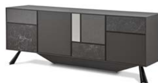
Buffet 3 portes MONDRIAA 2 751 euros